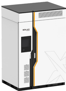
ULTRA-P16B57 ULTRA-P33B115 ULTRA-P50B172