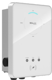
スマート EV 用充電器